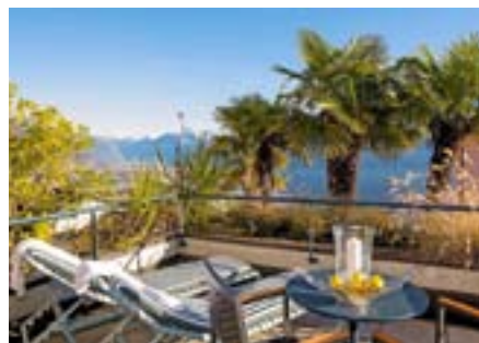
Die «Filiale» «La Barca Blu» in Orselina.

Eine Villa im Tessin! Die kleine, aber feine «Villa Orselina» hat sich in der Fünf-Sterne-Liga blitzschnell etabliert.